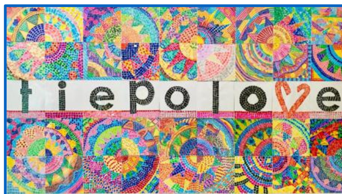
Elaborati grafici allievi –attività artistica 20/21 – prof.ssa Ronco